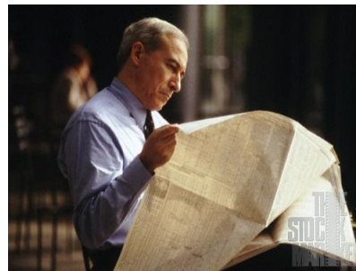
La combinación de la información diaria con los conocimientos técnicos, base de las decisiones en la inversión

El curso de BOLSA Y BROKER (nivel 1) o iniciación y/o perfección en la inversión en la bolsa se ha aumentado al doble la información sobre la estructura de los mercados y se ha incluido un módulo completo de análisis Técnico.